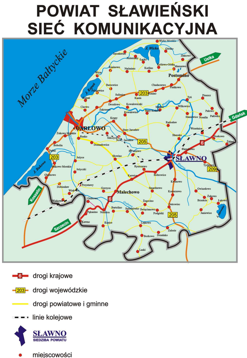
Rys. 3. Sieć komunikacyjna na terenie powiatu

Poniżej przedstawiono sieć dróg komunikacyjnych na terenie Powiatu Sławieńskiego.